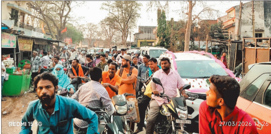
मालगाड़ी रूकने से बनी जाम की स्थिति

शुक्रवार 27 मार्च को रामनवमी के दिन जहां सक्ती सौंठी अड़भार मार्ग पर लोगों की भीड़ रही। वहीं टेमर रेलवे समपार पर जाम लगने से वाहनों की लंबी कतारें लग गई। यहां शुक्रवार 27 मार्च की शाम रामनवमी को शाम 5:15 बजे अचानक डबल इंजन वाली मालगाड़ी फाटक के बीचो बीच आकर रूक गई। मालगाड़ी के फाटक पर आधे से अधिक घंटे समय तक रूकने से दोनों ओर वाहनों की लंबी कतारें लग गईं। तकरीबन पौन घंटे के बाद मालगाड़ी निकली और फाटक खुलते ही दोनों ओर से वाहनों का रेंगा आने जाने लगा। इसके एक घंटे के अंतराल में फिर से गाड़ियों की आवाजाही को लेकर फाटक बंद कर दिया गया। जिसके कारण दोनों ओर गाड़ियों की लंबी कतारें