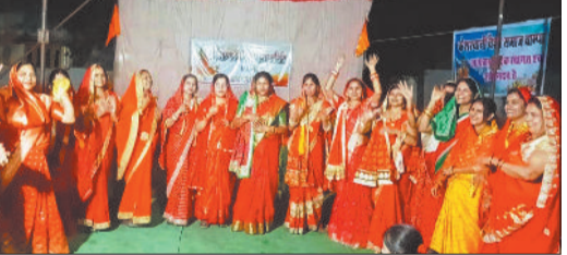
कार्यक्रम में उपस्थित केशरवानी महिला समिति के पदाधिकारी व सदस्य।

केशरवानी महिला समिति चांपा की सदस्यों ने केशरवानी वाटिका में भक्ति भाव के साथ नवरात्र उत्सव मनाया।