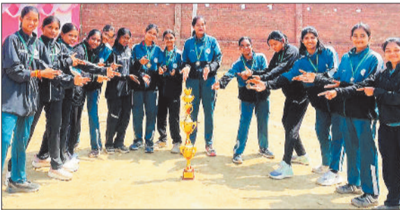
जीत के बाद उपस्थित बालिका टीम।

छत्तीसगढ़ की बेटियों ने उत्तर प्रदेश के मुजफ्फरनगर में आयोजित 38वीं जूनियर नेशनल नेटबॉल प्रतियोगिता में छत्तीसगढ़ की बालिका टीम ने अपने शानदार और जुझारू प्रदर्शन की बदौलत कांस्य पदक पर कब्जा जमाया है।