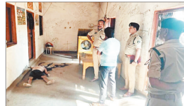
मौके पर जांच करने पहुंची पुलिस।