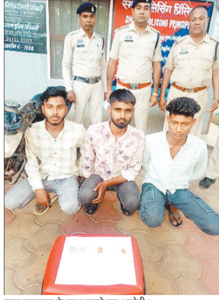
जट मशरूका के साथ पकड़े गए आरोपी।

एक सूने मकान का ताला तोड़कर अंदर प्रवेश कर सोना-चांदी के जेवरत, नगदी राशि लगभग 5000 रुपये एवं अन्य सामान सहित कुल 2-3 लाख रुपये मूल्य की चोरी की घटना को अंजाम दिया गया। प्रार्थी की रिपोर्ट पर थाना कोतवाली चौकी मानिकपुर में अपराध पंजीबद्ध कर विवेचना प्रारंभ की गई। अपराध पंजीबद्ध करने के बाद पुलिस द्वारा घटना की जांच कर आरोपियों की तलाश की जा रही थी। इसी दौरान मुखबरी से सूचना के आधार पर पुलिस ने तीन युवकों को गिरफ्तार कर पूछताछ की गई तो उन्होंने अपना अपराध स्वीकार करने की जानकारी दी। आरोपियों से मिली जानकारी के आधार