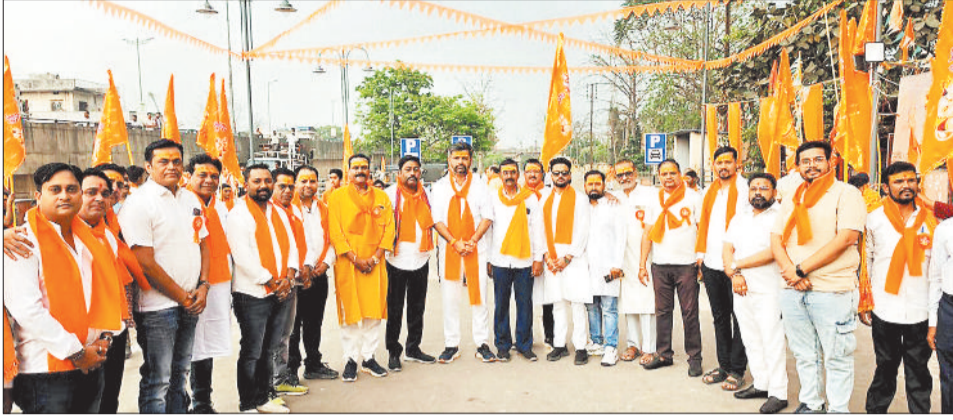
शोभा यात्रा में शामिल रामभक्त श्रद्धालु।

स्थानीय श्रीराम नवमी महोत्सव आयोजन समिति द्वारा नगर में शुक्रवार 27 मार्च को सायं 5 बजे से रेलवे स्टेशन के सामने स्थित पलटन बाबा के हनुमान मंदिर से भव्य एवं विशाल शोभा यात्रा का आयोजन किया गया। आयोजन के चलते सम्पूर्ण शहर राममय व भगवामय हो गया।