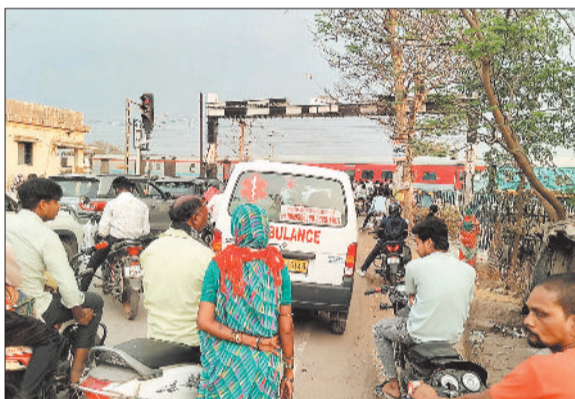
जाम में फंसा एम्बुलेंस।

फिर से लग गई। इस दौरान आने जाने वाले फाटक खुलने का इंतजार करते रहे। काफी देर बाद जब फाटक खुला तो आने जाने वालों की भीड़ के चलते जाम लग गया। इस जाम को खुलवाने में पुलिस के साथ राहगीरों के भी पसीने छूट गए। खास बात यह है कि इस जाम के दौरान मरीज सेवा में लगी एम्बुलेंस भी फंसी रही। उल्लेखनीय है कि लंबे समय से ग्राम पंचायत सौंठी के ग्रामीण सौंठी समपार के लिए बनाए जा रहे ब्रिज से जोड़कर, टेमर समपार फाटक के लिए भी ब्रिज बनाने की मांग कर रहे हैं। इसके लिए ग्राम पंचायत द्वारा प्रस्ताव भी पारित किया गया है। बहरहाल कारण चाहे चाहे जो भी